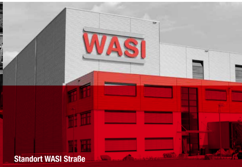
Standort WASI Straße