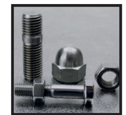
Umarbeitung einer Sechskant-Schraube DIN 931-M16, Drehteil nach Zeichnung