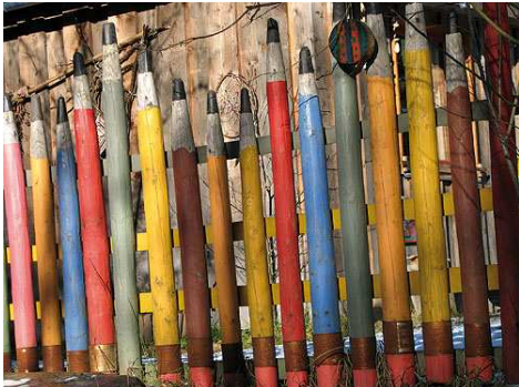
Individuelle Zäune erfordern individuelle Verbindungslösungen

Die Wagener & Simon WASI GmbH & Co. KG prüfte das Potenzial verschiedener Märkte. Dabei konnte der Bau von Metallzäunen als sehr zukunftssträchtige Branche identifiziert werden. Zaunbauer beziehen bei dem Wuppertaler Spezialisten für Edelstahl-